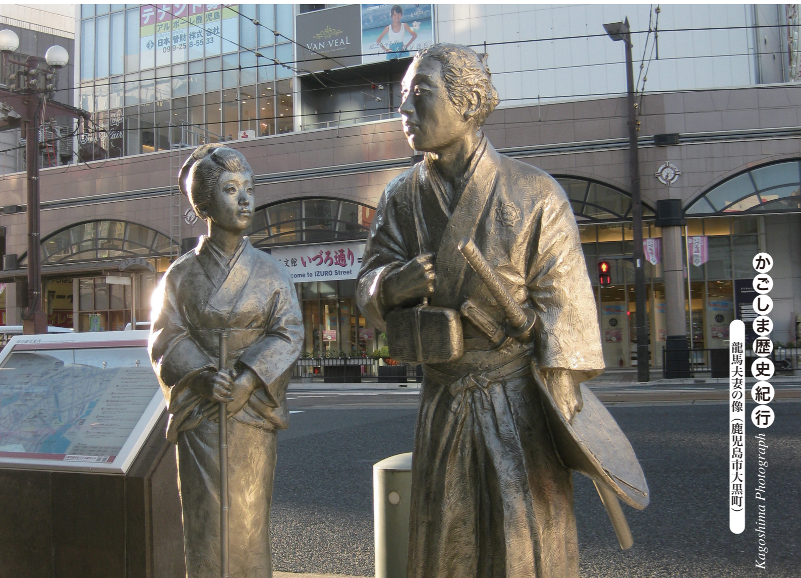
かごしま歴史紀行 龍馬夫妻の像(鹿児島市大黒町)

〒892-8588 鹿児島市東千石町1番38号 TEL099(225)9500 FAX099(227)1619 http://www.kagoshima-cci.or.jp Eメール somubu@lime.ocn.ne.jp