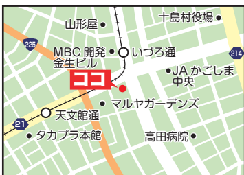
所在地 龍馬夫妻の像 (鹿児島市大黒町)