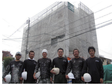
職人のみなさんと現場にて

るなんて無理だ。下請けで入れるところを探した方がいい」とも言われました。しかし、「それでは自分の求めていることが出来ない。今までは出来なかったかもしれないが、自分なら出来る」と信じ、直売の塗装屋を始めました。 お客様のかかりつけの塗装屋になりたいという思いで仕事に取り組んできました。お客様が使った材料名やメーカー、色番号は全てまとめ、管理しています。 一年に一度、無料でアフターの点検をさせていただいたり、お客さまへの感謝気持ちを伝えたいという想いから、一年に一回感謝祭を開催しています。