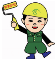
イメージキャラクター「塗装屋まっちゃん」

従業員のマナー向上のためには、まず、自分がしている様子を見せるようにしています。お客様はもちろんのこと、ご近所の方、通行人の方にも