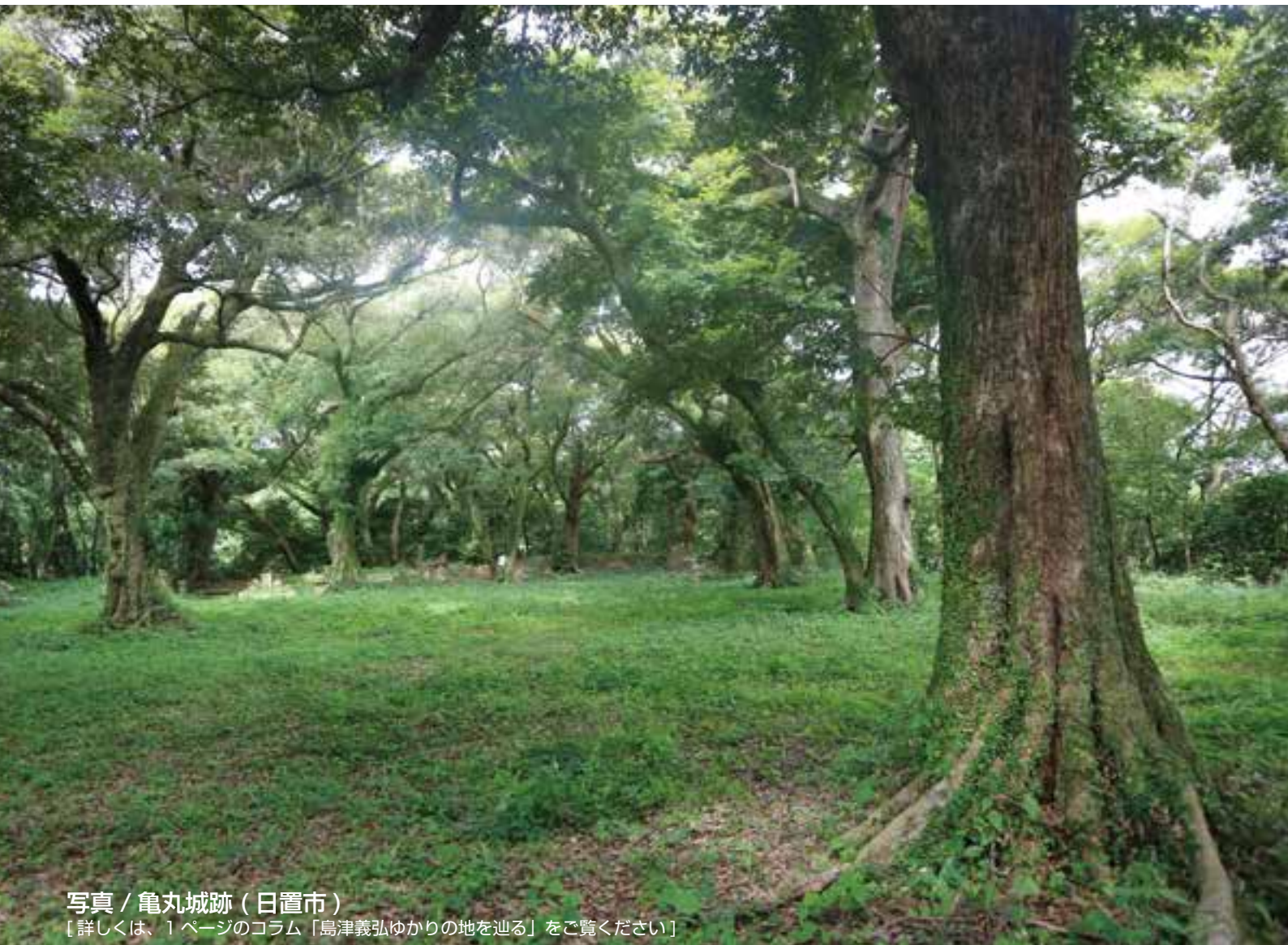
写真 / 亀丸城跡 (日置市)