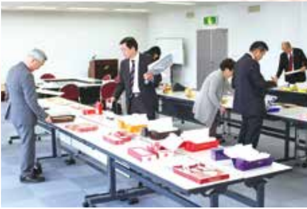
▲ 公正競争規約に基づき商品を確認する審査員