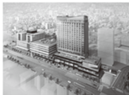
キラメキテラス 外観パース

これからの病院は、これまで以上に地域に開かれる必要があると考えており、地域住民の方々の「街区への導入口」としての役割、そして地域の方々の活動の場となる「地域交流センター」として役割を担えるよう、デイケア空間とエントランスホール、カフェをつなげて一体利用できるようになっています。