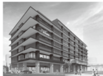
新病院 外観パース