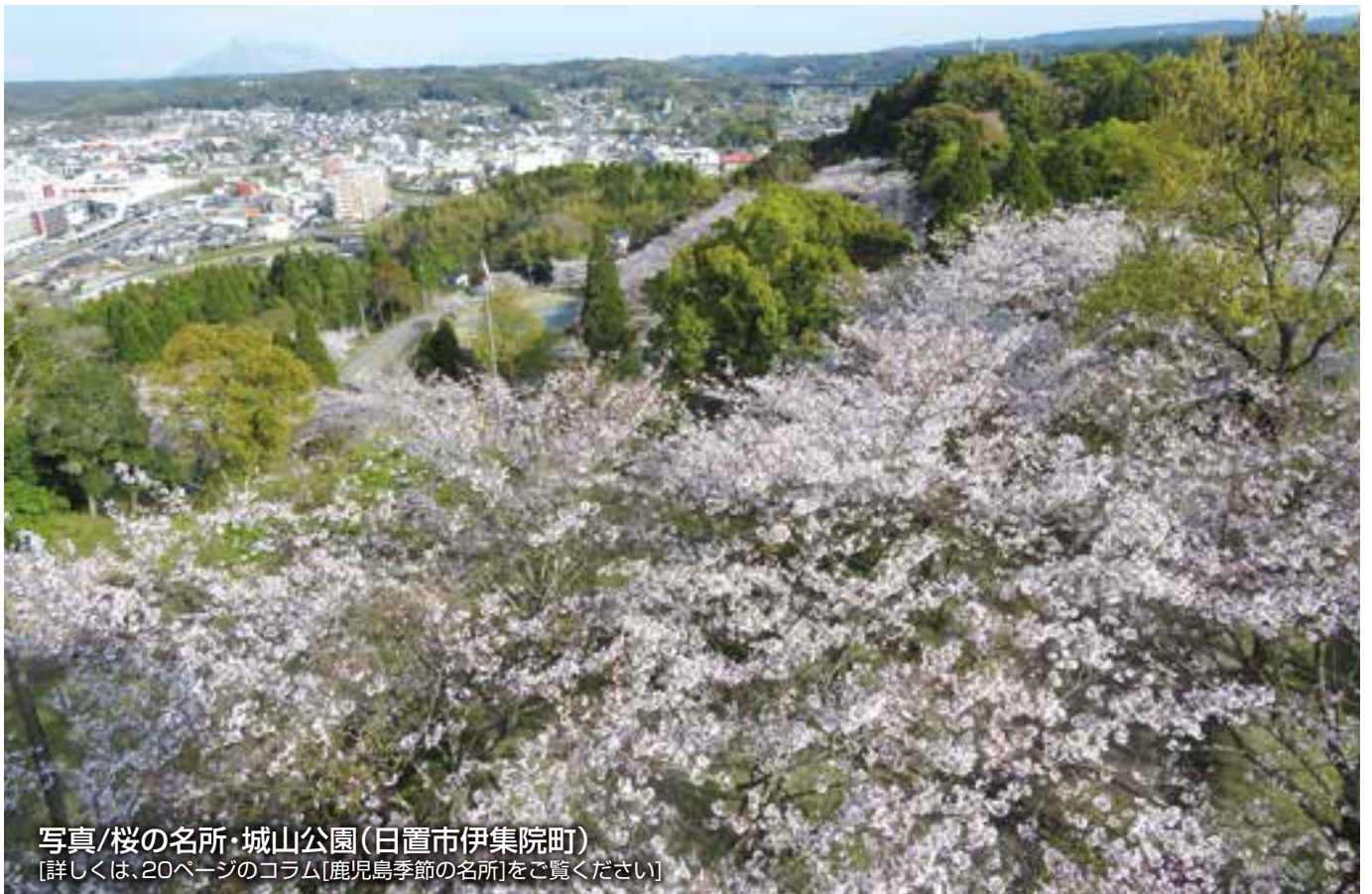
写真/桜の名所・城山公園(日置市伊集院町) [詳しくは、20ページのコラム[鹿児島季節の名所]をご覧ください]

鹿児島商工会議所 〒892-8588 鹿児島市東千石町1番38号 TEL:099-225-9500 FAX:099-227-1619 http://www.kagoshima-cci.or.jp E-mail:soumu.kcci@sage.ocn.ne.jp