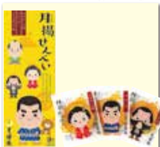
月揚げせんべい 話合せ