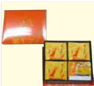
さつまどりサブレ プレーン