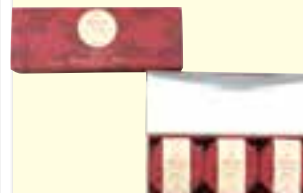
鹿児島シナモンティー (12包×3セット)