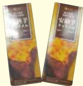
安納芋キャラメル