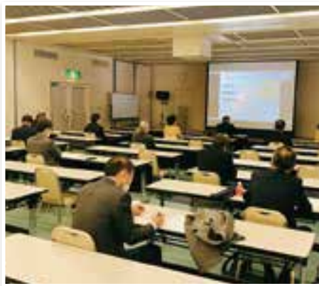
※感染対策を徹底した会場受講の様子