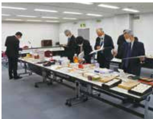
↑ 公正競争規約に基づき審査を行う審査員

認定審査会では、7名の審査員が「観光土産品の表示に関する公正競争規約（以下、公正競争規約）」に基づき、「必要表示事項」、「過大包装の事項」、「特定事項の事項」、「不当表示の事項」の4項目について、商品が適正な状態であるか厳正な審査を行った。審査の結果、13社43品を認定した。