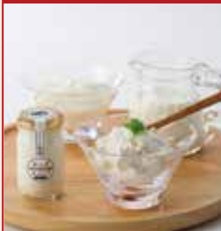
素材には伊佐牧場のチーズを使用。2021年3月時点で、「ブレン」「安納芋」「すんだ」の3種を販売

創業 2010年5月 会社設立 2017年5月 TEL 099-298-9640 (チーズホイップ工房) 099-298-9593 (晴レ屋) ホームページ https://kujira-farm.com