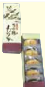
万羽鶴もなか(5個入)