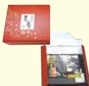
寿庵の黒豚しゃぶしゃぶセット