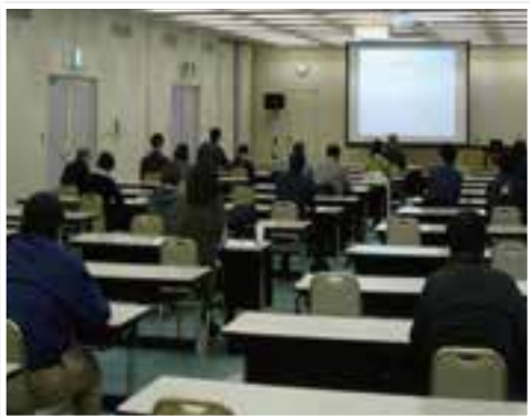
※オンライン参加者にも資料を事前配布し、会場同様のワークショップを実施した