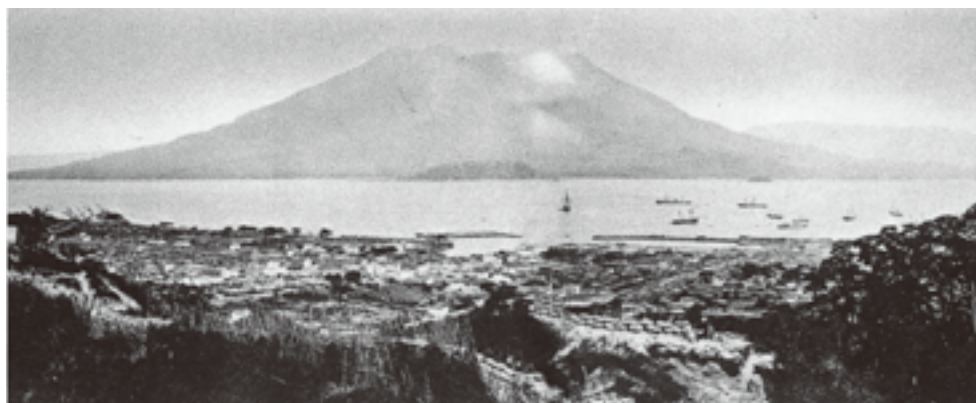
西南戦争後の鹿児島市街地

その後、我が国は日清、日露戦争に勝利し、農業国から工業国の道を歩みはじめることになった。鹿児島県でも産業基盤の整備が進められ、多くの工場が新設された。