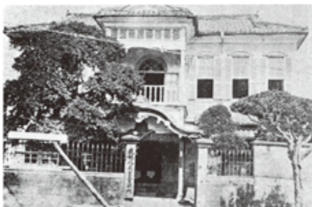
明治43年当時の鹿児島商業会議所

このような中、明治15年3月、西南戦争からの復興を目的とし、山田海三ら16名の発起により「鹿児島商法会議所」が創立された。明治11年に渋沢栄一らによって日本最初の商法会議所である東京商法会議所が創立されてから、全国で18番目の創立である。当時は、商工業者が任意に組織した会員制の私的団体であった。