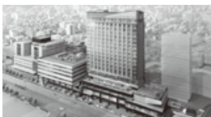
図1.2023年にグランドオープン予定のキラメキテラス

健康経営とは、従業員の健康管理を促進し、健康維持に努めることで企業の生産性の向上を図るものである。激減する生産年齢人口の確保は経営の生命線とも言え、健康管理の徹底が重要である。これを機会に健康経営に取り組んでみてはいかがだろうか。