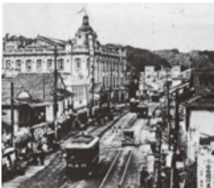
山形屋百貨店の新築(大正5年)によって活気がみなぎるいづろ通

鹿児島港は、藩政時代から海外貿易の実績もあり、日清戦争後の輸入量は毎年増加の一途をたどっていた。しかし、政府指定の開港（貿易港）