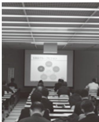
※感染防止対策をとった上で開催