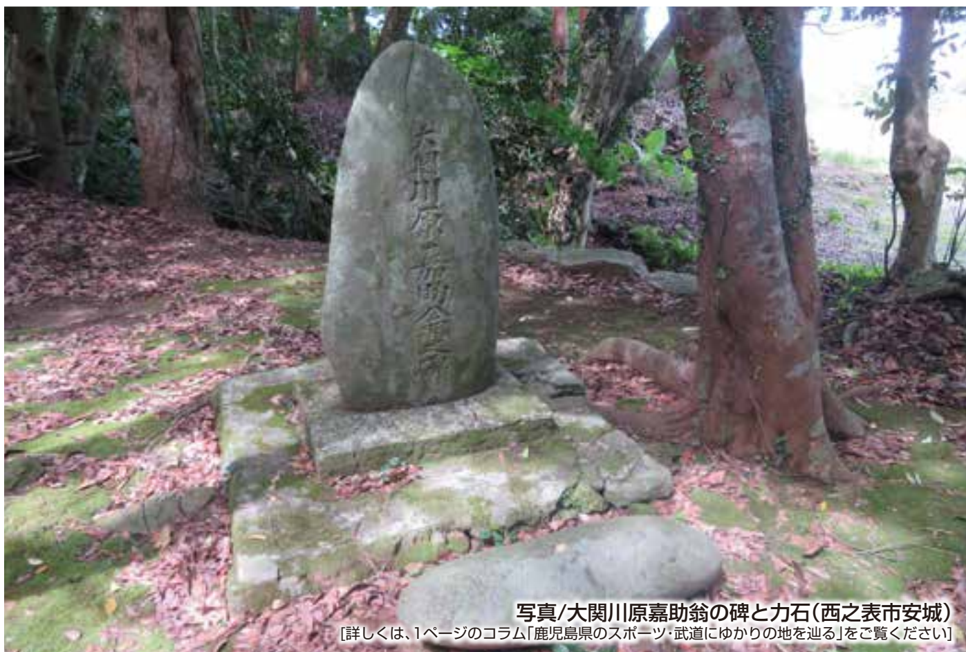
写真/大関川原嘉助翁の碑と力石(西之表市安城)

[詳しくは、1ページのコラム「鹿児島県のスポーツ・武道にゆかりの地を巡る」をご覧ください]