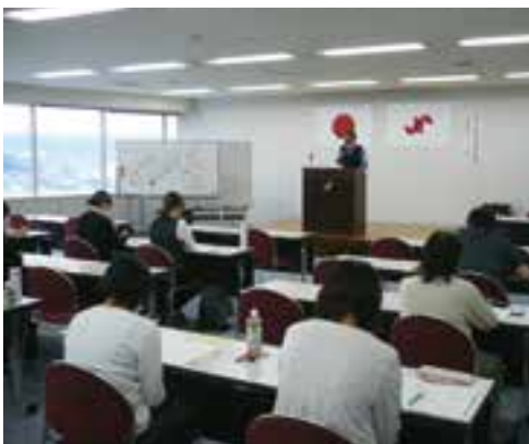
※セミナーは、コロナ感染対策をとった上で開催

参加者からは、「身近に使う制度ばかりなので、覚えておきたいことばかりだった」「実務でどのように対応すればいいのか分からず、迷うことがあったが、対処の方法や何故そうなるのかを知ることが出来、理解が深まった」等の感想が寄せられた。