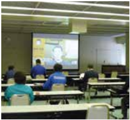
※写真は、ZOOM参加ができない方向けに、コロナ感染対策をとった上で開催した会場受講の様子

11月10日、イーンスパイア株式会社横田秀珠氏を講師に招き、SNS活用セミナーを開催した。本セミナーは、新型コロナウイルス感染症対策の観点から、「ZOOM」によるオンラインセミナーとして開催し、16社20名が参加した。 セミナーでは、9月から導入されたマイナポイント事業の概要や、キャッシュレス決済と連携したSNS活用の基礎知識について、具体的な事例や実演をもとに解説があった。 受講者からは、「支払ツールだったキャッシュレス決済が販促ツールへ意識が変わった」「業種・業態・売り方に合ったアプリの選別や、客単価等の要素やブランディングなどの目的に応じた販促手法がわかりやすかった」などの声があった。